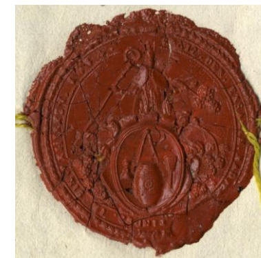
PÉCSI KÁDÁR CÉH PRIVILÉGIUMÁNAK PECSÉTLNYOMATA

„TOVÁBBLÉPNI A BORRAL VALÓ GONDOLKODÁSBAN – A BOROZGATÓ MAGYAROK KÖNYVSOROZAT ISMERTETÉSE”