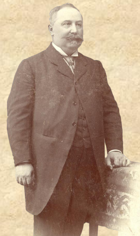
CSOMA JÓZSEF 1848 – 1917 történész, heraldikus, genealógus